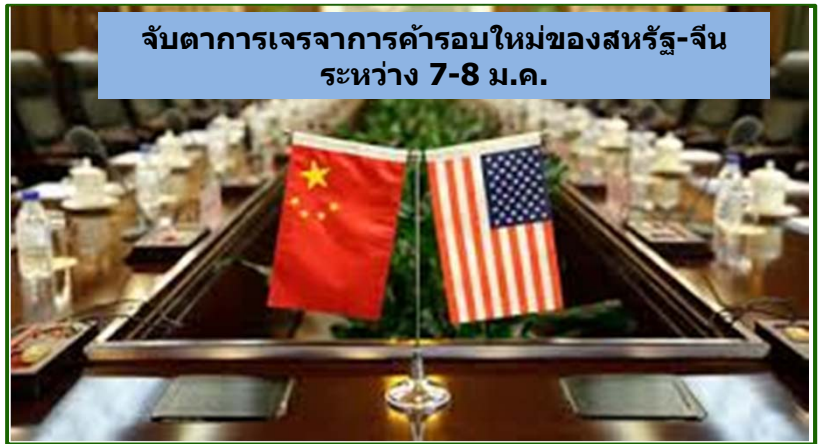
จับตาการเจรจาการค้ารอบใหม่ของสหรัฐ-จีน ระหว่าง 7-8 ม.ค.