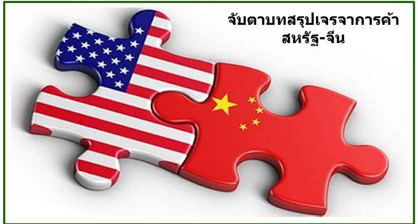
จับตามทสรุปรเจรจาการค้า สหรัฐ-จีน