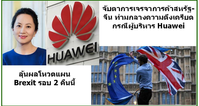
จับตาการเจรจาการค้าสหรัฐ-จีน ท่ามกลางความตึงเครียดกรณีผู้บริหาร Huawei