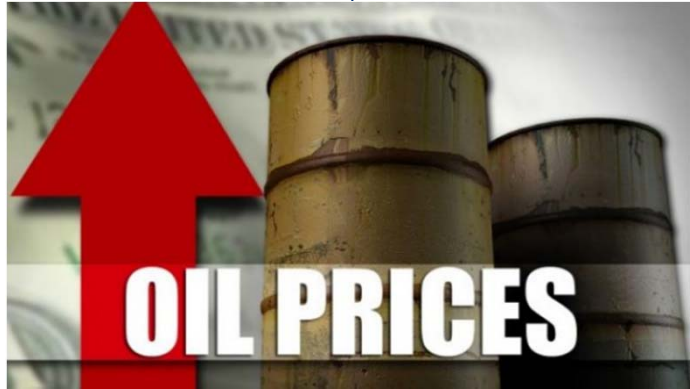
ราคาน้ำมันพุ่งขึ้นต่อเนื่อง