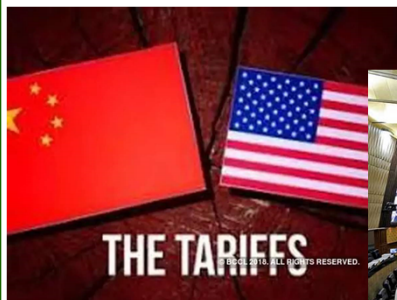
สงครามการค้าสหรัฐ-จีน