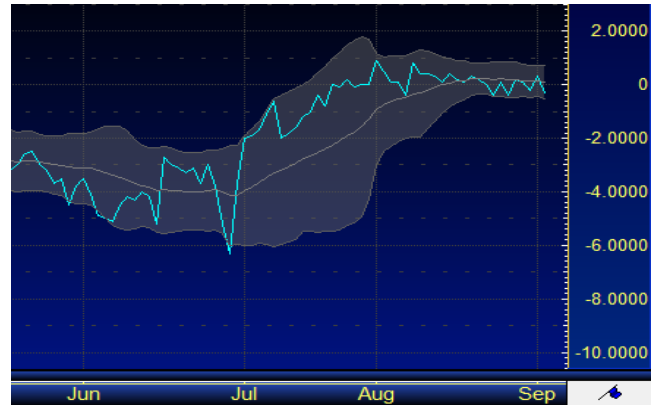
รูปที่ 1: Spread ระหว่าง S50U16 และ S50Z16