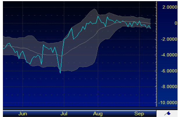
รูปที่ 1: Spread ระหว่าง S50U16 และ S50Z16