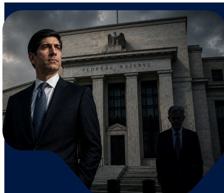
Kevin Warsh ประธาน Fed คนใหม่ กับทิศทางนโยบาย การเงิน